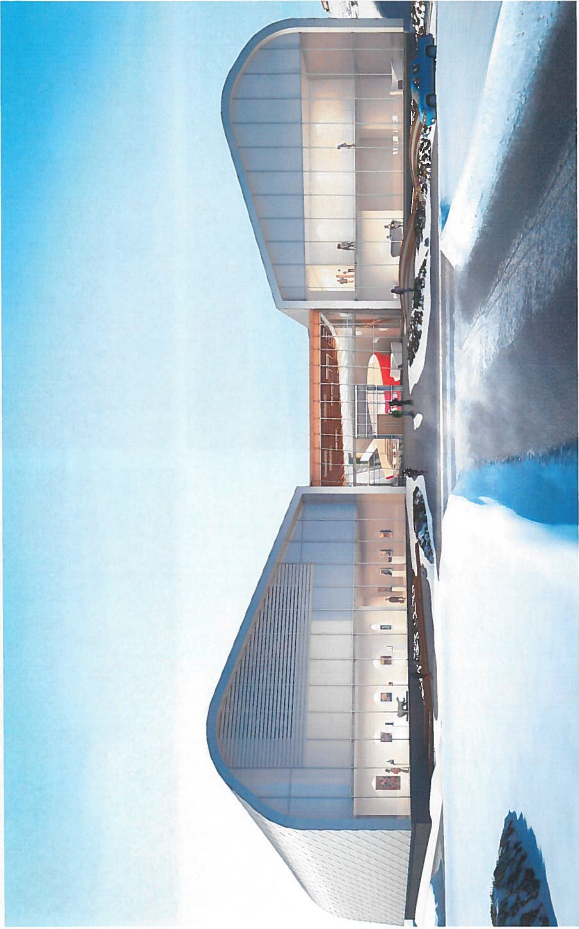
ርዕይ 8: ጋራ ገንቢ ለጥበቃና ጥበቃ ምክርቤት ለማስፈጸም የሚያስፈልጉ ስራዎች (የጥበቃና ጥበቃ ምክርቤት ለማስፈጸም የሚያስፈልጉ ስራዎች)።