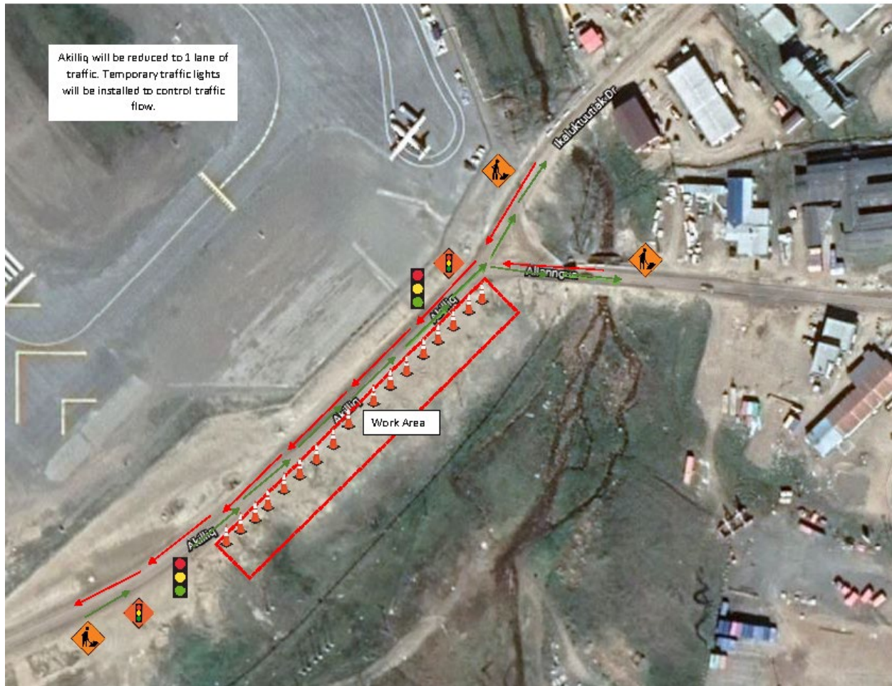
La Carte C

ᐃᖅᑲᐃᖅ ᐃᖅᑲᐃᖅ ᐃᖅᑲᐃᖅ ᐃᖅᑲᐃᖅ ᐃᖅᑲᐃᖅ ᐃᖅᑲᐃᖅ ᐃᖅᑲᐃᖅ ᐃᖅᑲᐃᖅ www.iqaluit.ca