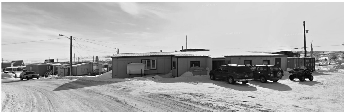
Bâtiment 778 sur Fred Coman Street

Du côté sud-ouest de Core Area, la Uquutaq Society a déposé une demande d'aménagement DP 20-062 pour augmenter la capacité actuelle du bâtiment 778 de 20 à 42 lits et effectuer des rénovations intérieures. Ce refuge ouvert à tous fournira un programme de répit de nuit sans politique standard de tolérance zéro par rapport à l'intoxication et trois (3) membres du personnel assureront le service auprès des hommes et des femmes vulnérables. Ce changement permettra de réduire les obstacles existants qui limitent l'accès aux services à certaines personnes.